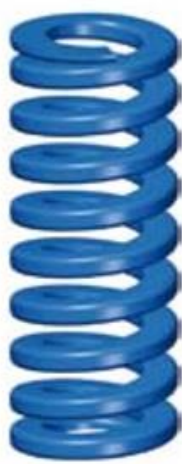
2. Medium - Belasting