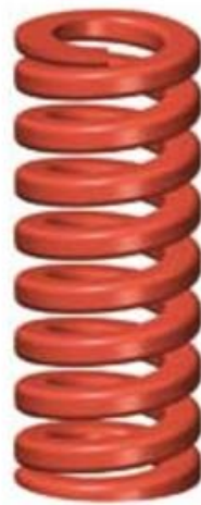
3. Zware Belasting