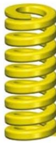
4. Zware Belasting