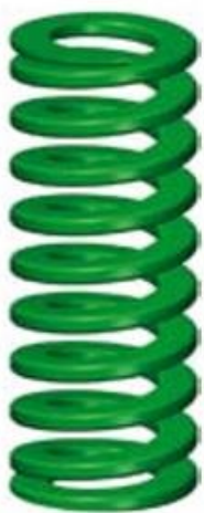
1. Lage Belasting

1 kp = 9,80665 newton, 1 newton = 0.10197 kp