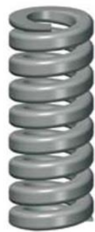
5. Ultrazware belasting. Zie afzonderlijke tabel